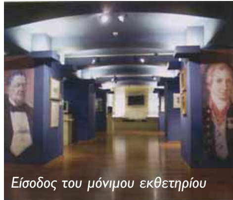
Είσοδος του μόνιμου εκθετηρίου