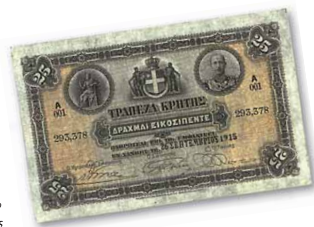
Τράπεζα Κρήτης 1899-1919 25 δραχμές 1ης έκδοσης

Το Ιστορικό Αρχείο αποτελεί ζωτικό κύτταρο της επιχειρηματικής συμβολής και πολιτιστικής προσφοράς της Εθνικής Τράπεζας, μέσα από τη μελέτη της οικονομικής εξέλιξης του νεοελληνικού κράτους και την παροχή ελεύθερης πρόσβασης σε τεκμήρια του πολιτιστικού πλούτου. Το υλικό που διαχειρίζεται προέρχεται στο μεγαλύτερο μέρος του από τα Αρχεία της Εθνικής Τράπεζας, και καλύπτει την περίοδο από το 1841 μέχρι το 1966.