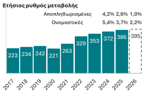
Πωλήσεις επιχειρηματικού τομέα ετήσια μεταβολή

Πηγή: Elstat | Εκτιμήσεις: Εθνική Τράπεζα