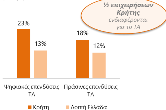
Διάθεση επένδυσης στην επόμενη μέρα (% ΜμΕ)

Ενώ τα επιμέρους μέρη της πυραμίδας ανάπτυξης της Κρήτης είναι παρόντα και με μικρές σπίθες να είναι ήδη ορατές, οι καταλύτες για την ουσιαστική ενεργοποίησή της και την ανάπτυξη συνεργειών είναι: